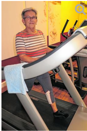
Avant fitness & more (FR)

Weitere Informationen über Kursangebote gibt es unter www.avant-fitness.de , Telefon unter 0421 / 89 89 63. Geöffnet ist montags bis donnerstags von 8.30 bis 21.30 Uhr und freitags von 6 bis 20 Uhr sowie sonnabends von 10 bis 14 Uhr und sonntags von 10 bis 18 Uhr.